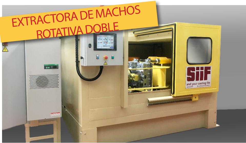
EXTRACTORA DE MACHOS ROTATIVA DOBLE